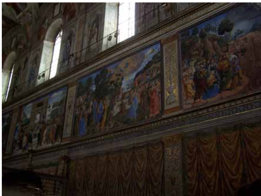
Det Sixtinske Kapel