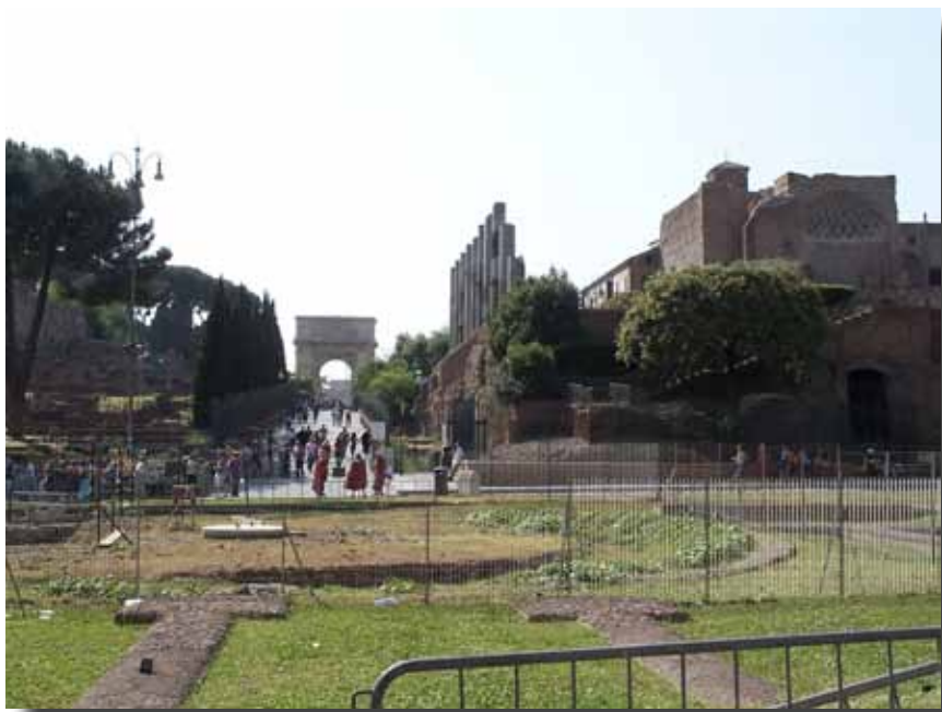
Via Sacra, den hellige vej, der forenede alle de større templer. Set fra Colosseum