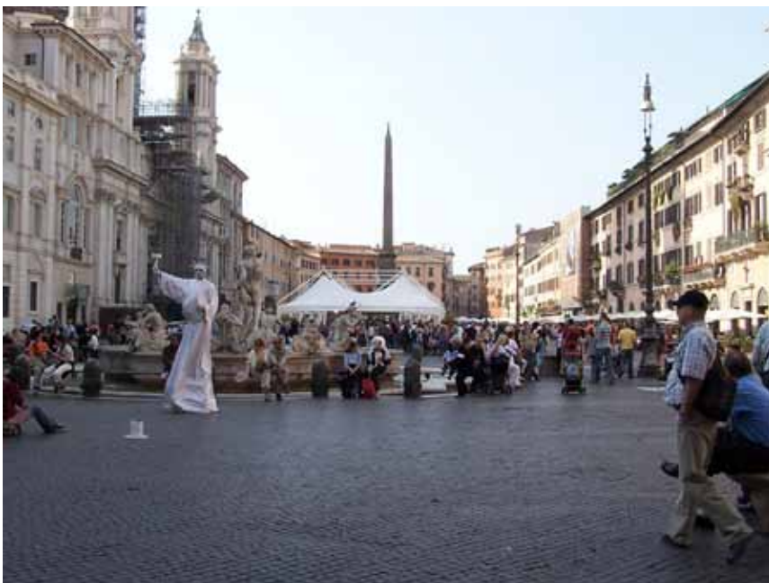
Stadig Piazza Navone