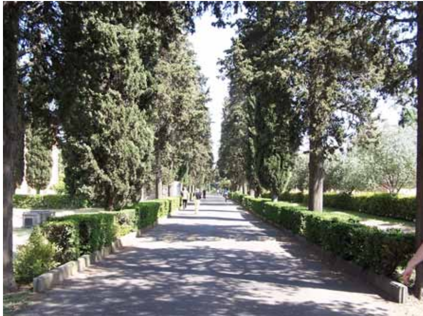
Motiver ude ved nogle af Roms Katakomber.