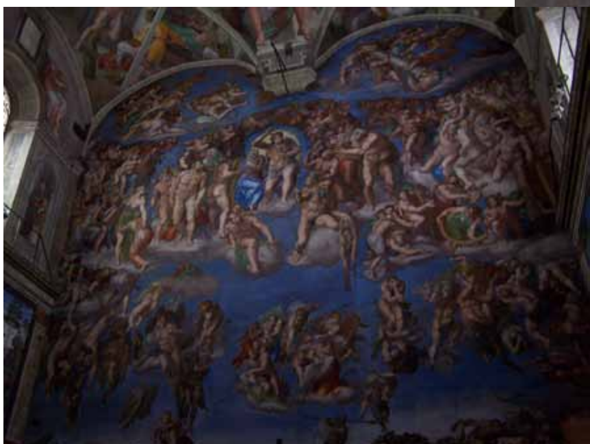
Gavlen i Det Sixtinske Kapel