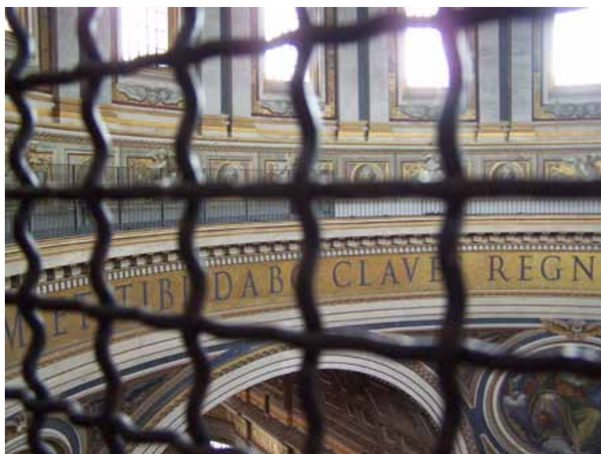
På vej op til toppen af kuplen. Her er vi i buegange, der løber hele vejen rundt.