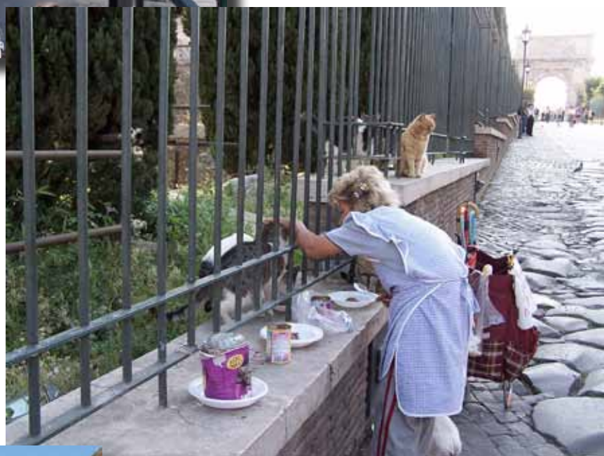
Der var mange herreløse katte i Forum Romanum. De fik en hjælpende hånd af en venlig dame.