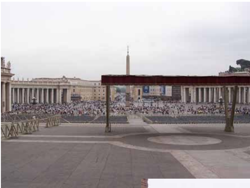
Peterspladsen, set fra kirken