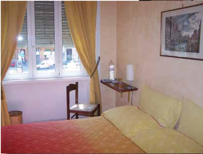
Værelset var rimelig med eget bad og toilet