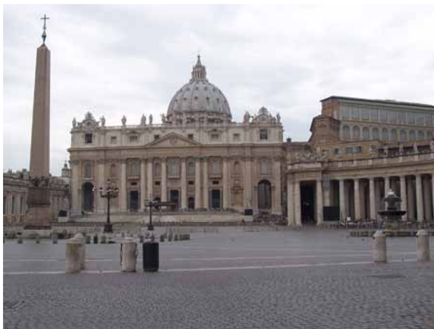
Peterspladsen med Peterskirken i baggrunden