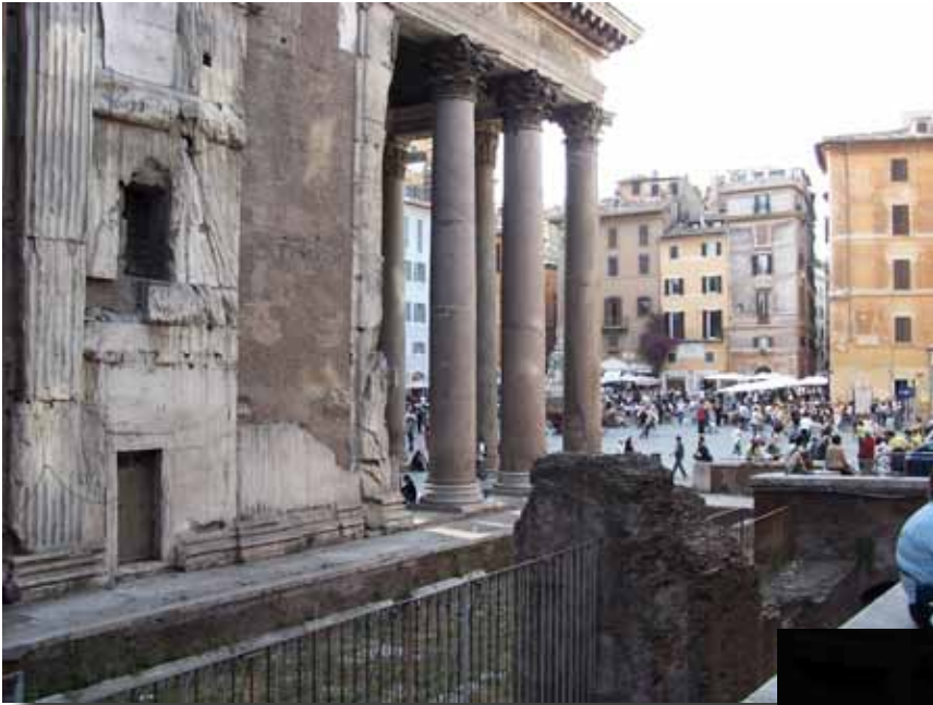
Pantheon, bygge 120 e. Kr. af kejser Hadrian