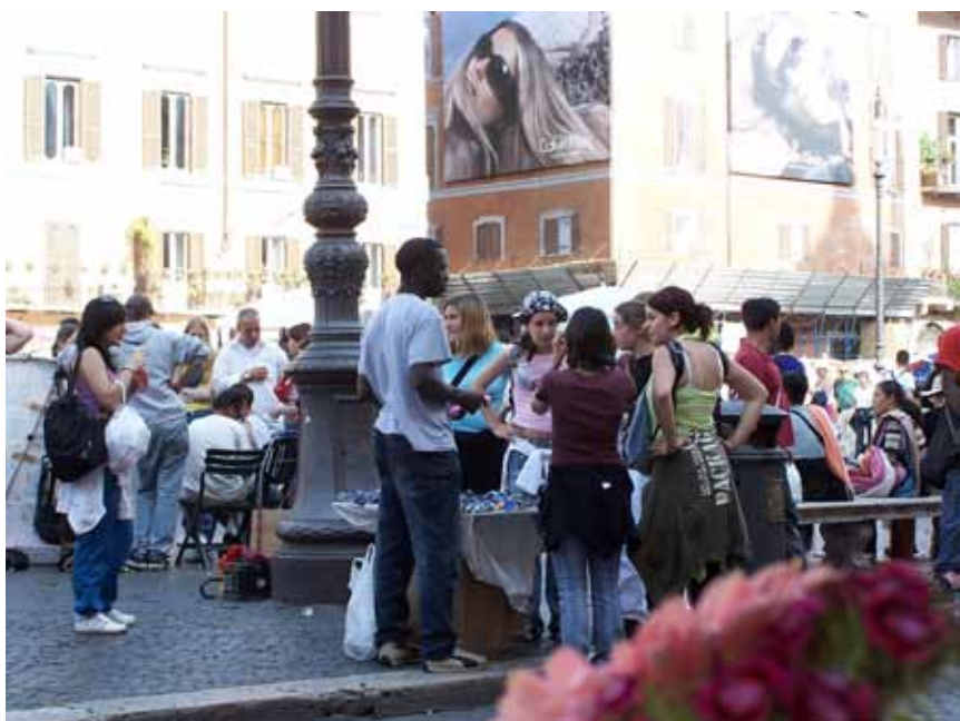
Gadehandlere i aktion på Piazza Novona