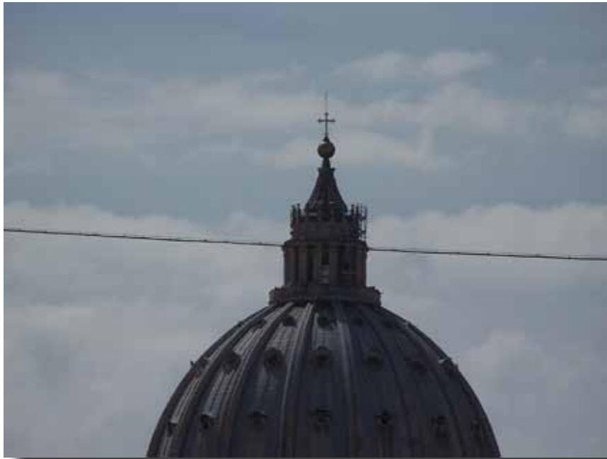
Kuplen på Peterskirken, fotografert med zoom