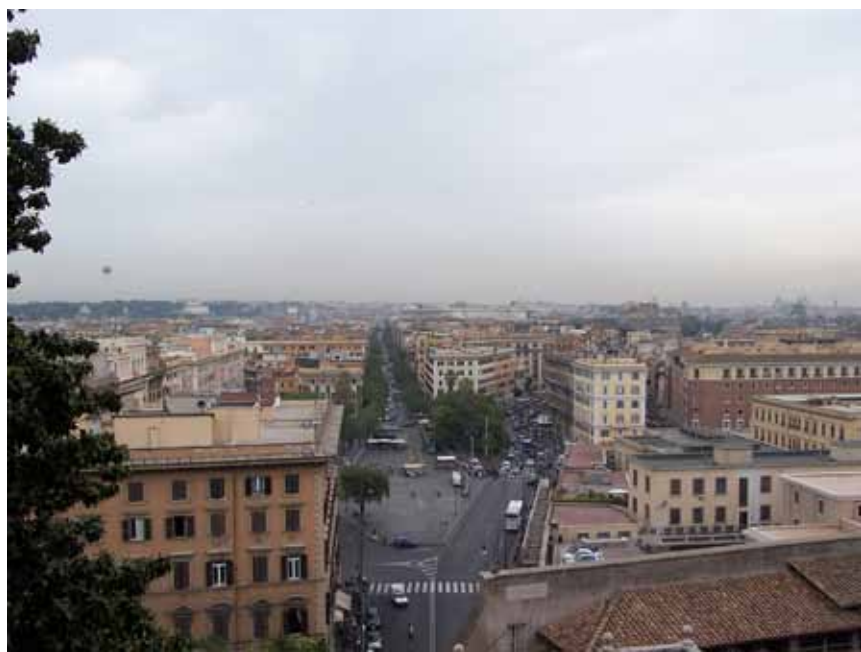
Udsigt ud over Rom, set fra Vatikanmuseerne