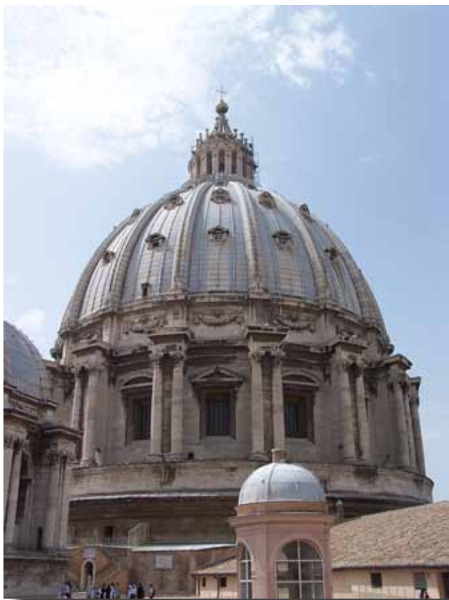
Her oppe står folk og nyder udsigten