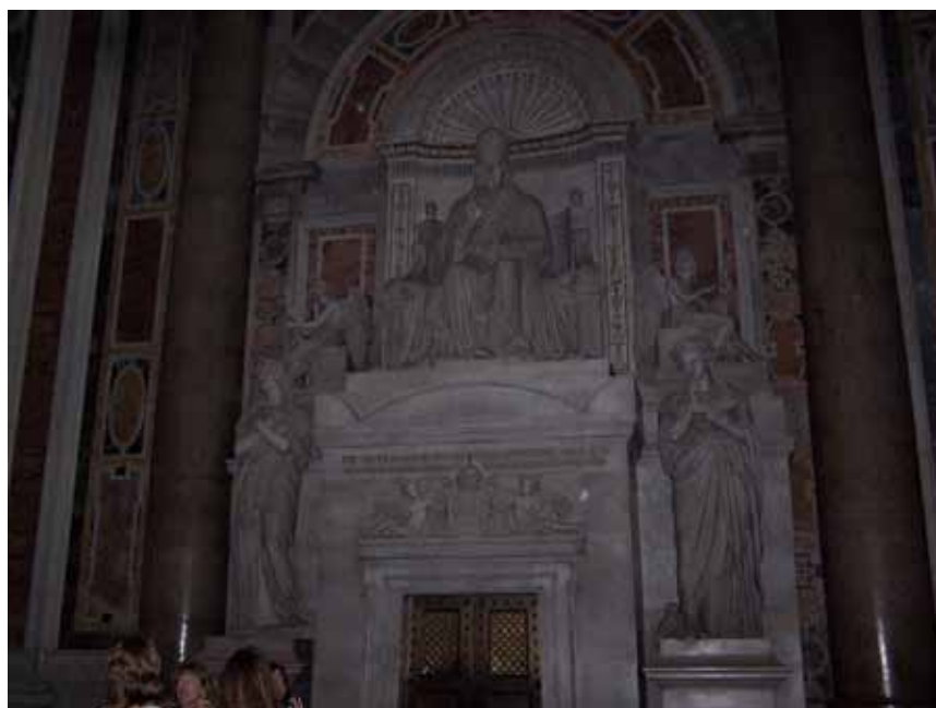
Berthel Thorvaldsens monument over Pius 7.s gravmæke