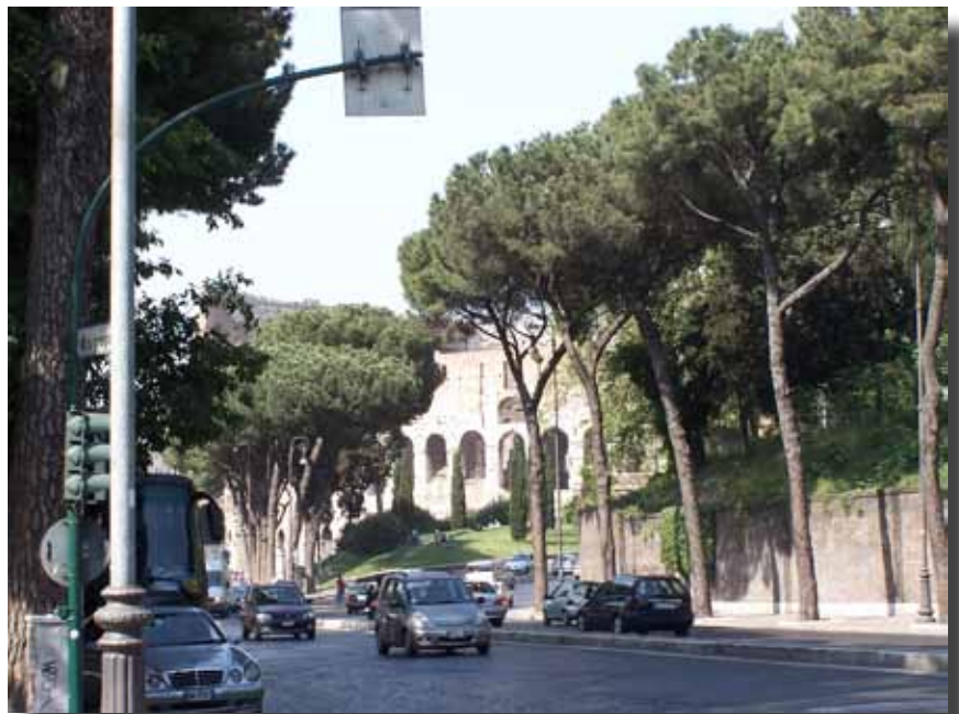
Via de S. Gregorio på vej mod Colosseum