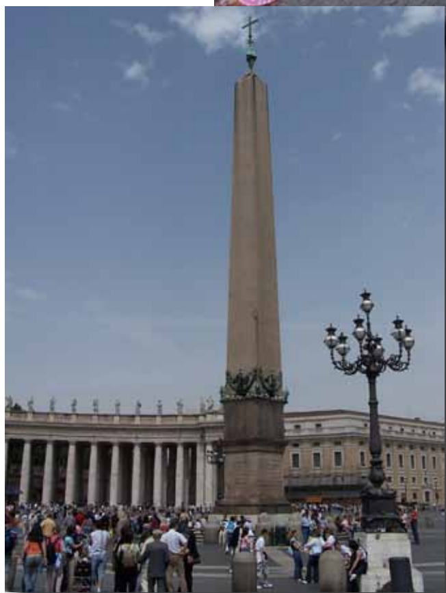
Obeliskens på Peterspladsen