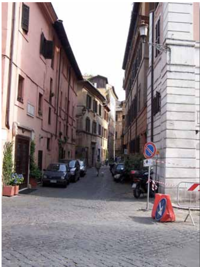
Endnu et par små, stille gader i Rom