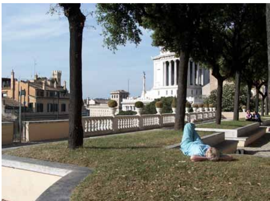
Hviletid på Palatinerhøjen