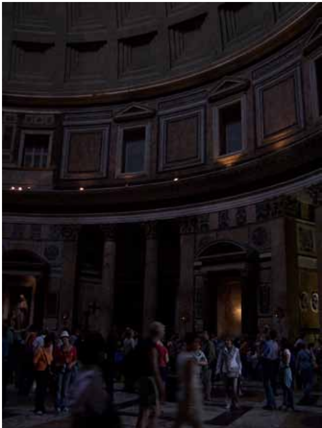
Pantheon, set indefra. Kuppelens diameter og højde er 43,30 meter, hvor af hlvadelen udgør selve kuppelen