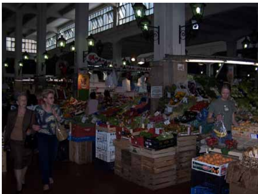
Kød- og frugtmarked midt i Rom