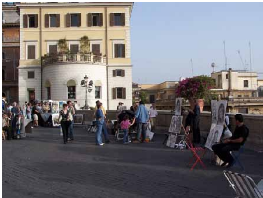
Aktivitet lige oven over Den Spanske Trappe