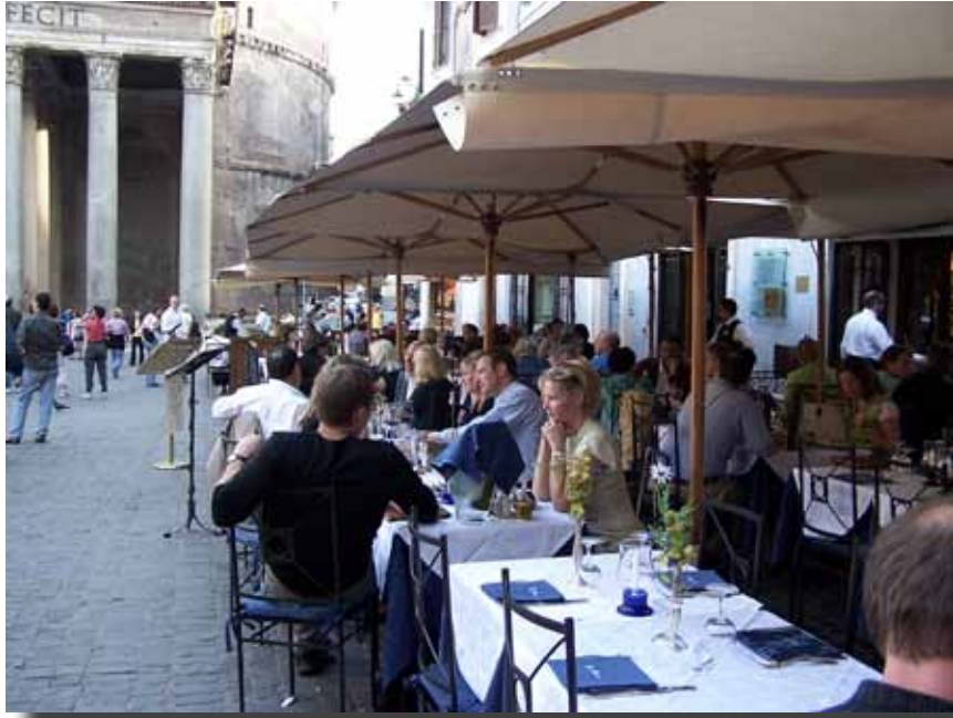
Piazza delle Rotonda ved Pantheon