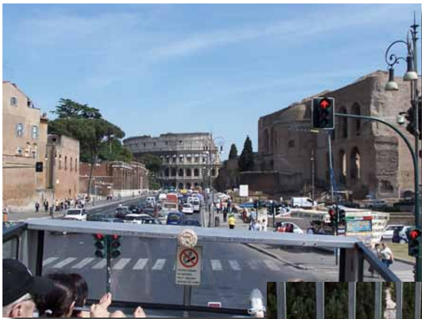
Colosseum, set fra toppen af en sightseeingbus