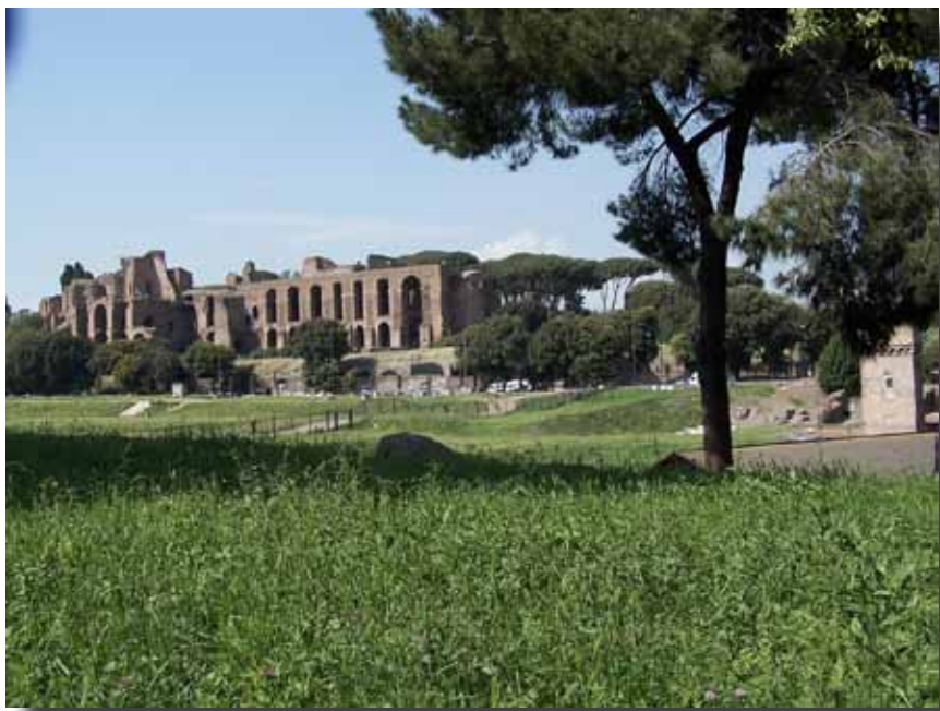
Circus Maximus i forgrunden med Septimius Sverus' Palads og Arkade.