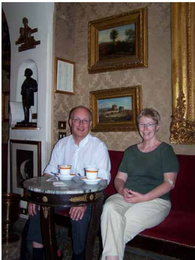
Vi drak kaffe på Café Grecco. Her holdt alle de danske kunstnere til før i tiden. Bl.a. H.C. Andersen, hvis billede hænger nederst på billedet her neden under.