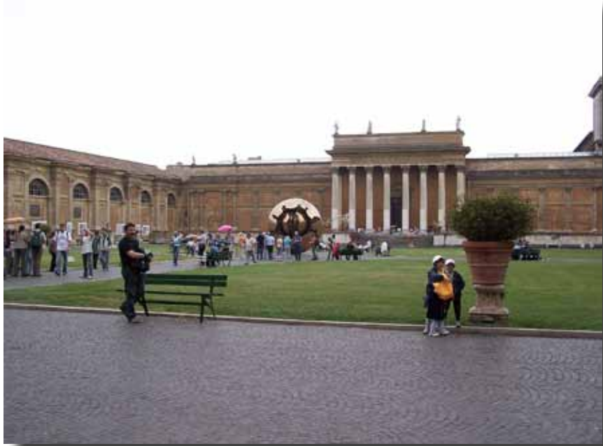
Lørdag besøgte vi Vatikanmuseerne