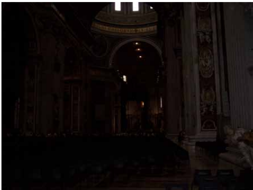
Hovedskibet i Peterskirken med kuplen i baggrunden