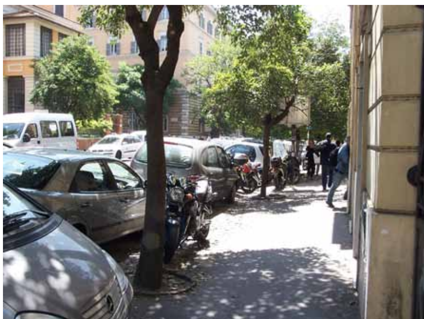
Endnu et billede af parkeringsproblemerne i Rom