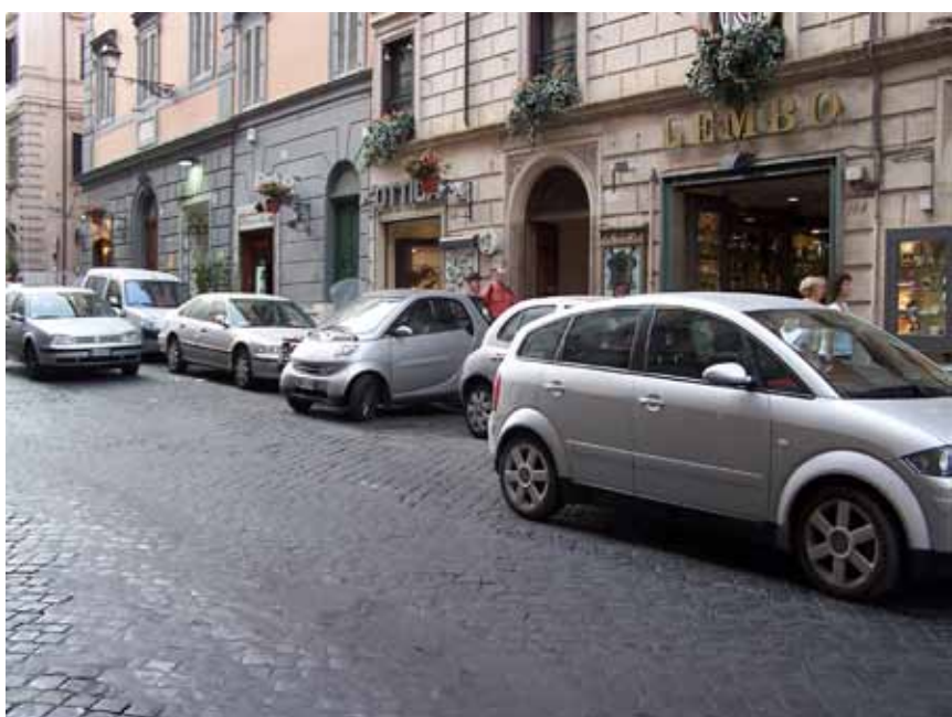
Parkering er et kapitel for sig selv i Rom. Her er en smagsprøve. Alle bilerne på billedet var parkeret.