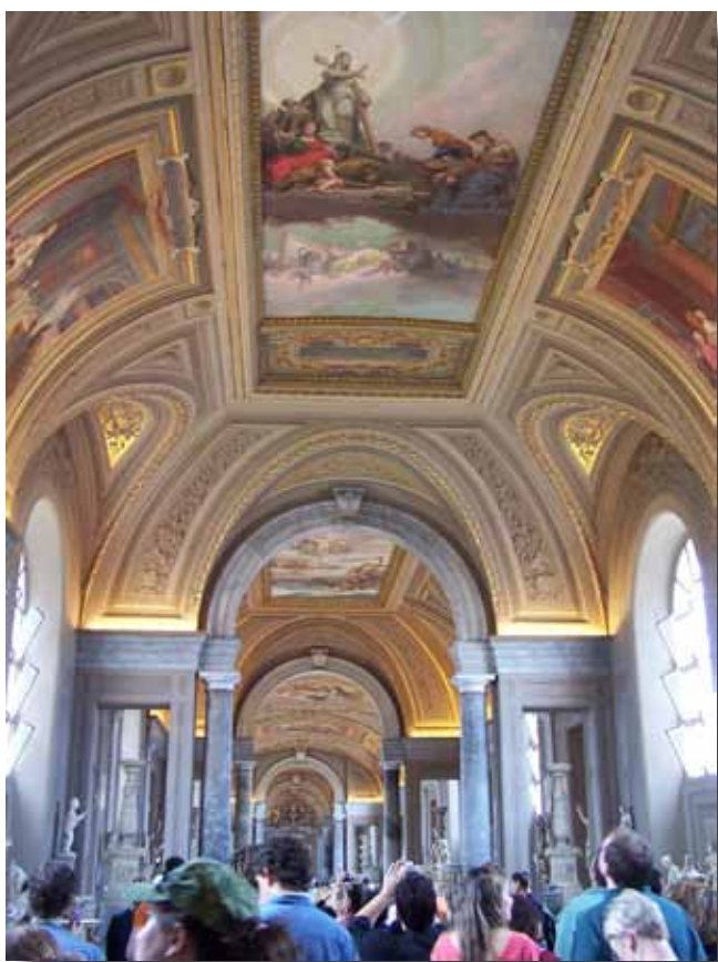
Jeg tror nok det er loftet i Galleria delle Carte Geografiche.