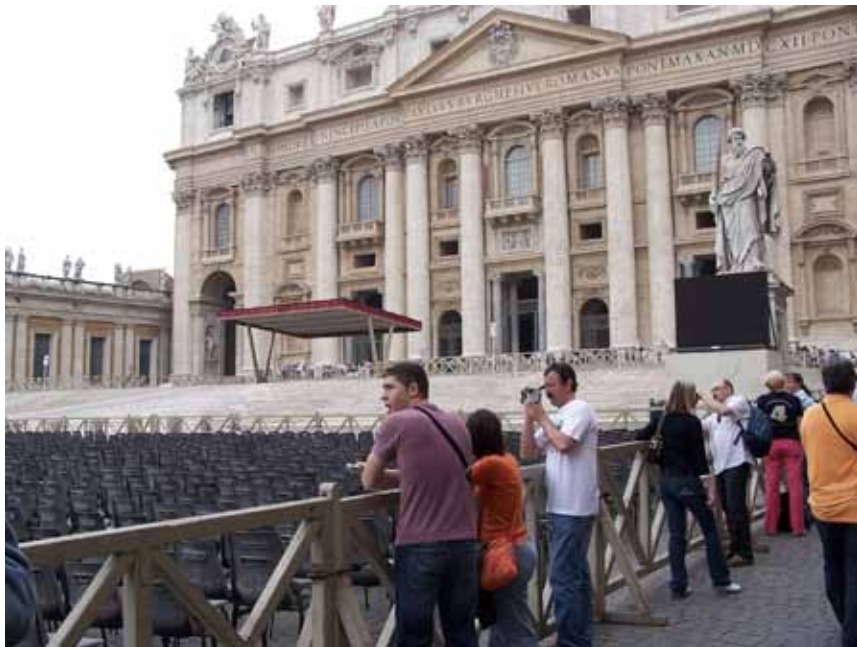
Indgangen til kirken