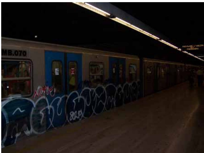
Roms undergrundsbaner. Det er to linier. Her er toget på den ene. Godt overbroderet med graffiti, så meget, at det undertiden var umuligt at se ud af vinduerne.