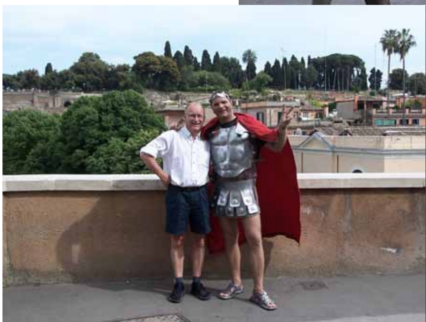
Et par gæve krigere ved Forum Romanum