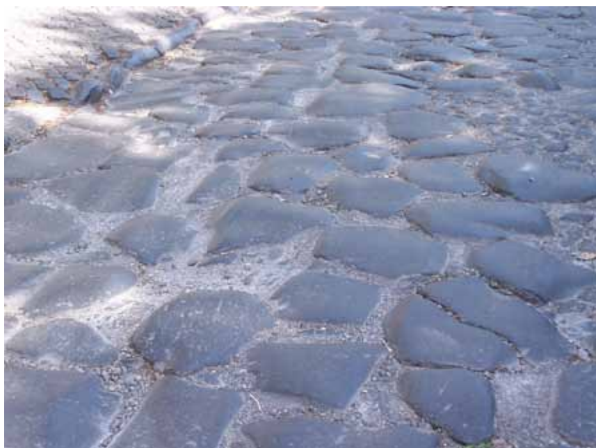
Oldtidsvejen Via Appia Antica med de store brosten