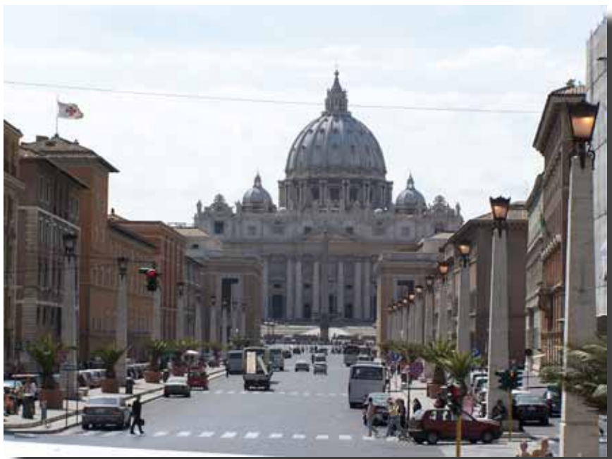
Peterskirken, set fra Via delle Conciliazion