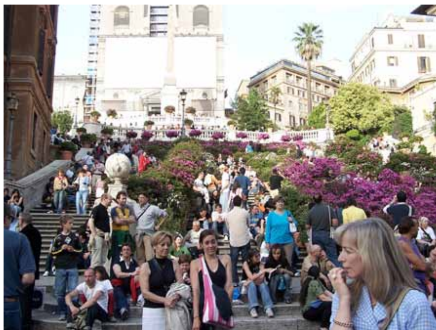
Den Spanske Trappe. Her var der mange mennesker