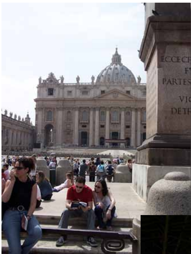
Peterskirken set ned fra Via della Conciliazione