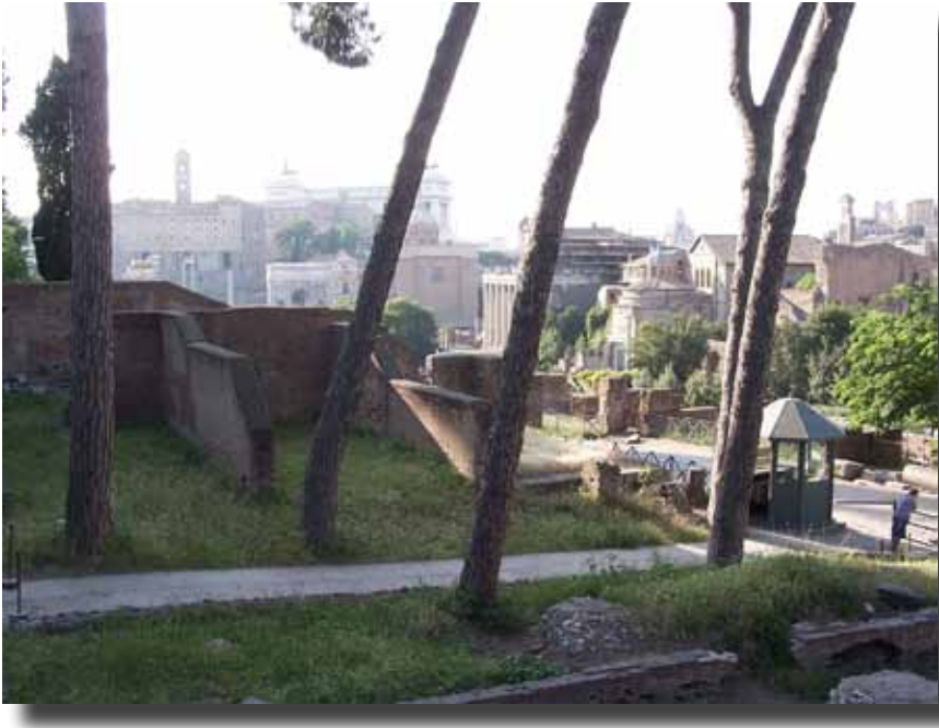
Forum Romanum set fra forskellige punkter.