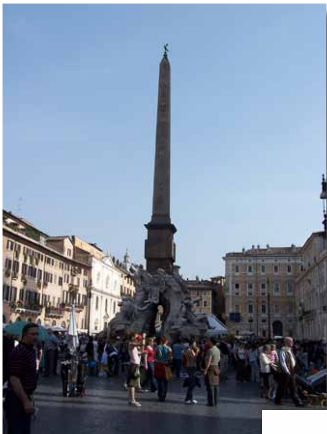
Flodernes Fontæne på Piazza Navona