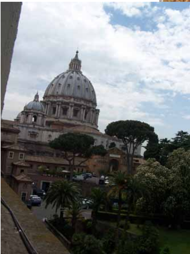
Et kik over mod Peterskirkens kuppel