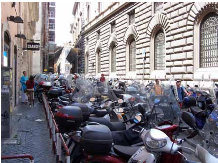
Forskellige transportmidler i Rom. Vi prøvede en åben sightseeingbus.