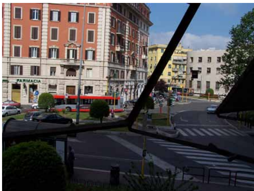
Udsigt fra værelset ned på Piazza Bologna.