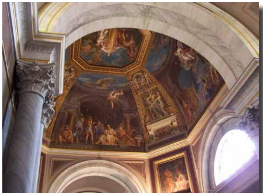
Loftet i en af de mange sale, der er på museet