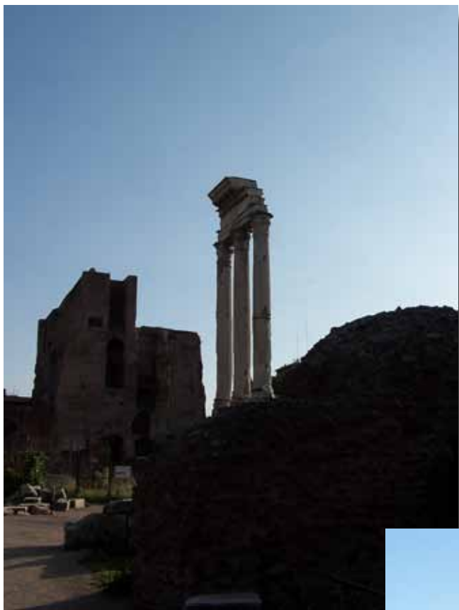
Castor- og Pollyx-templet