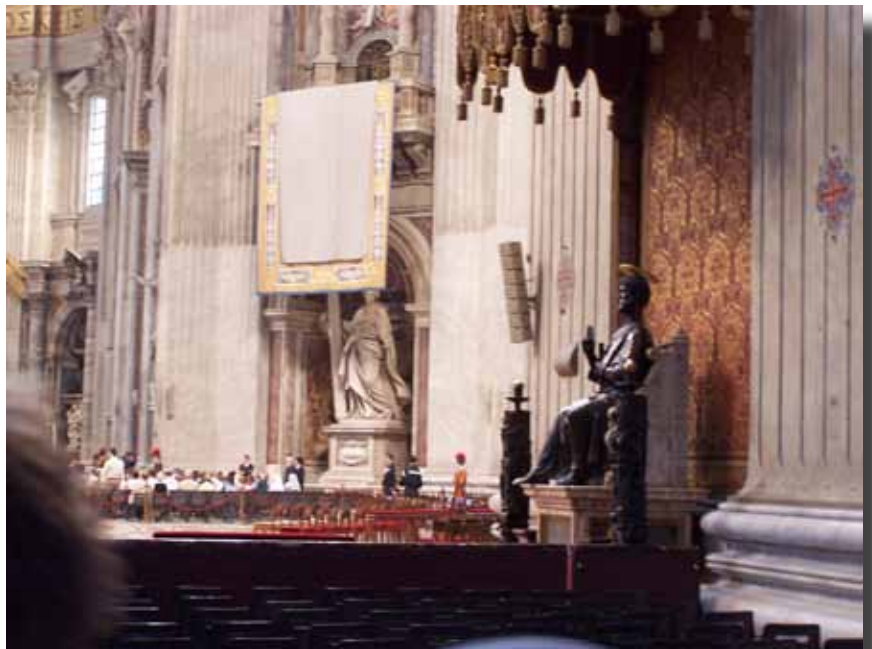
Bronzestatue af St. Peter