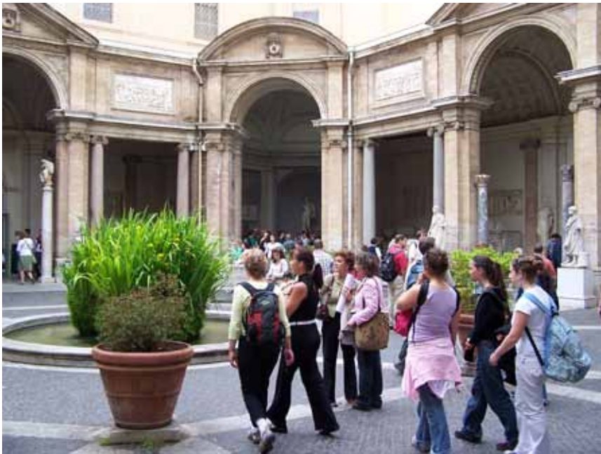
En gård inde på Vatikanmuseet