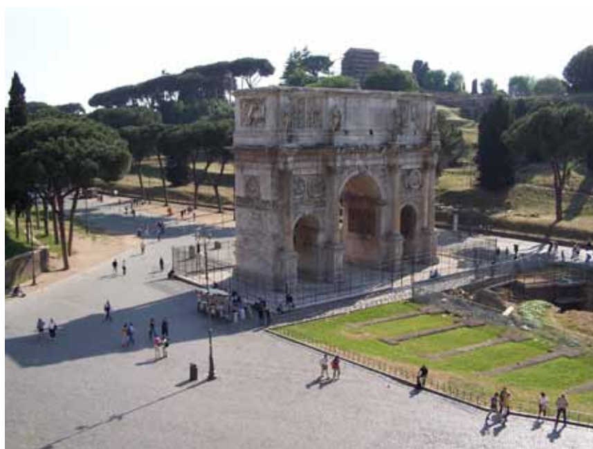
Konstantin Buen, set oppe fra Colosseum