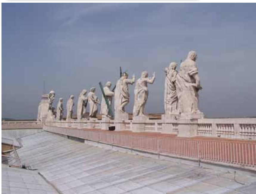
Her ses de statuer, der står oven over indgangen til Peterskirken