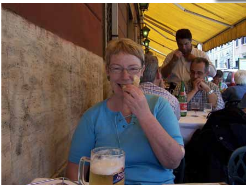
Så er der tid til frokost