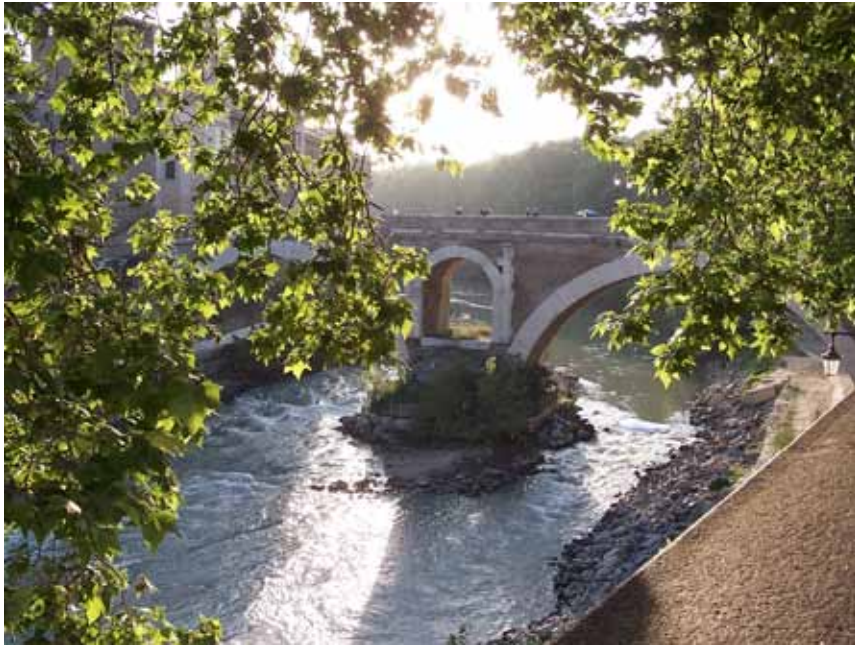
Ponte Fabricio broen over til Tiberøen er bygget i 62 f. Kr.