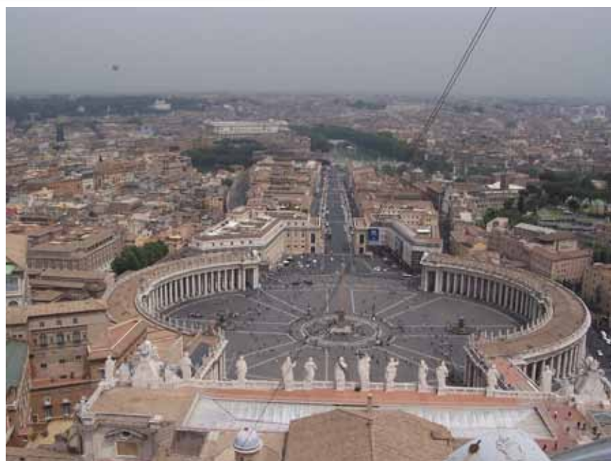
Peterspladsen, set oppe fra kuplen