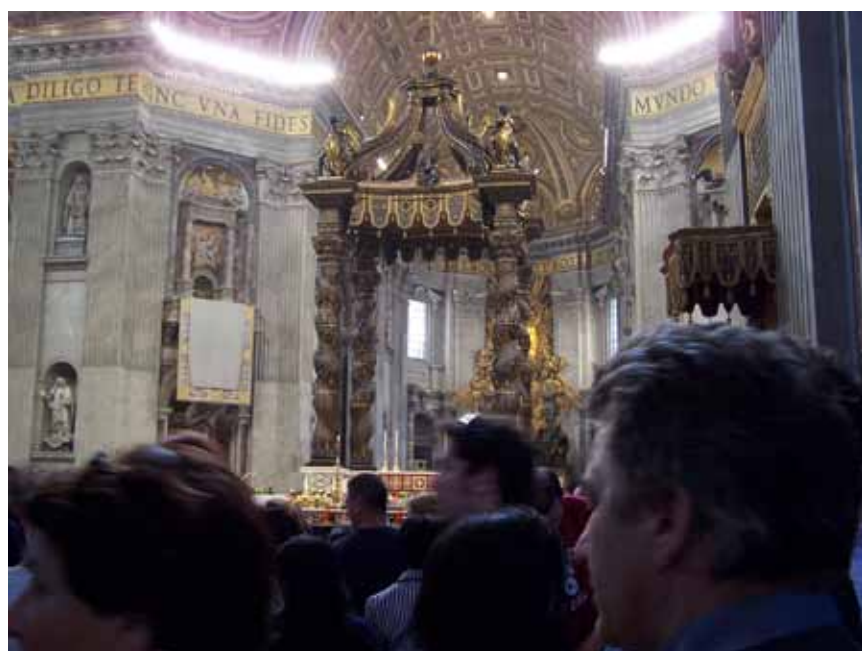
Sidst på eftermiddagen gik vi ind i kirken igen. Tilfældigvis var der en messe, hvilket betød at de kraftige lamper i kuplen var tændt, så det var meget bedre at fotografere derinde.