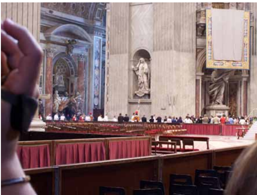
Præster i procesion. Det grå tæppe øverst oppe dækker for et billede af en nonne. Billedet blev afsløret under højtidligheden.