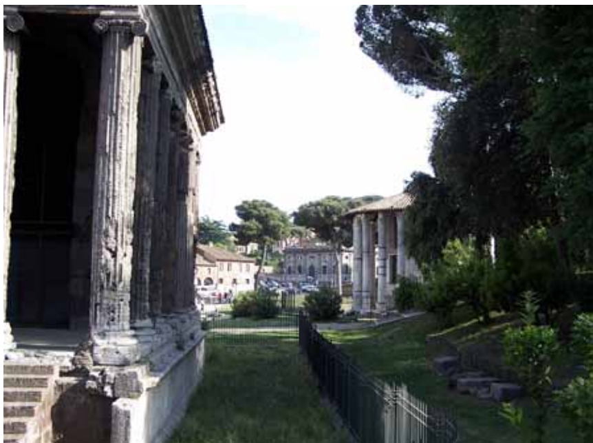
Nogle flere ruiner i Rom. hvisnok en af de første kristne kirker (den runde)