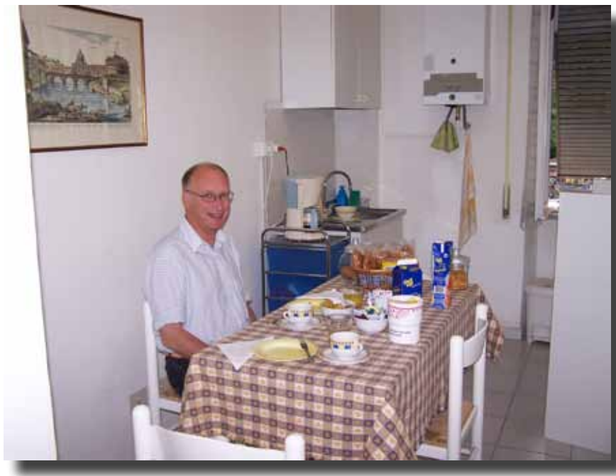
Der var et lille køkken, hvor morgenmaden blev serveret. Der var køleskab og micro-bølgeoven til fri afbenyttelse