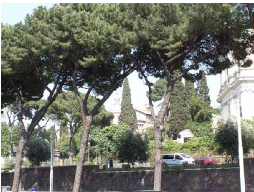
Via de S. Gregorio på vej mod Colosseum