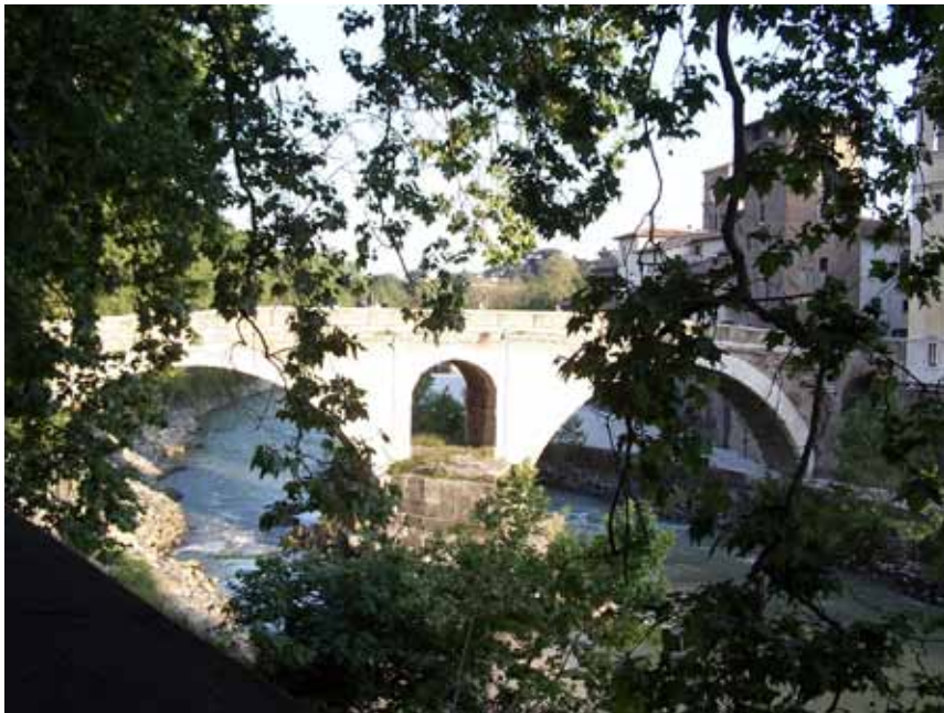
Broen set fra den anden side.