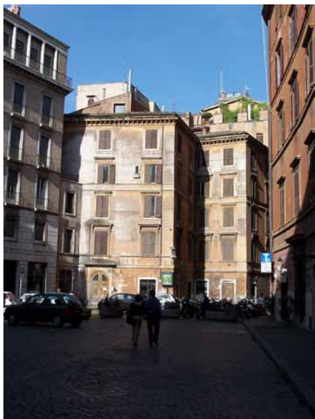
Flere stille gader i Rom