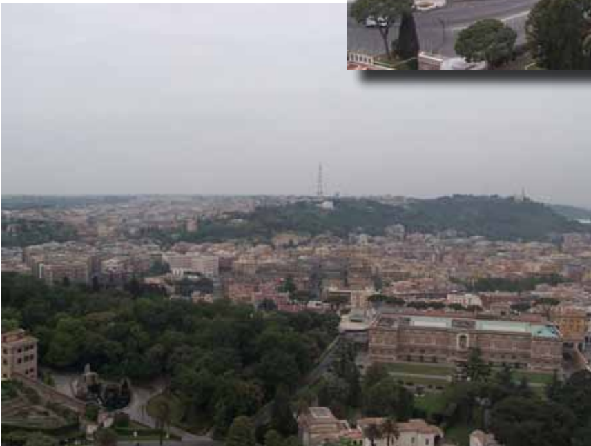
Udsigt over Rom fra Peterskirkens kuppel