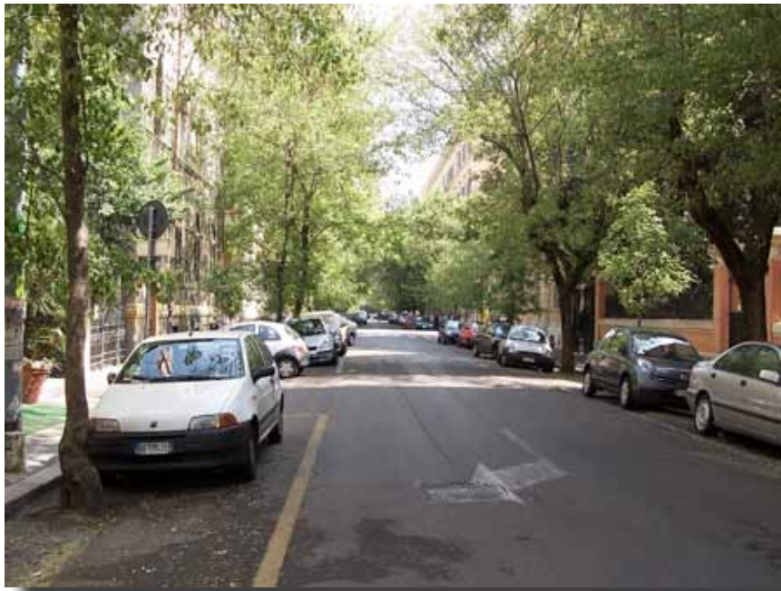
Stille gader i Rom