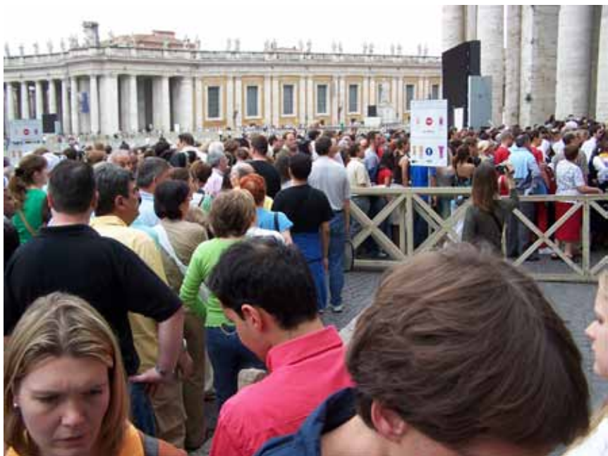
I kø for at komme ind i Peterskirken